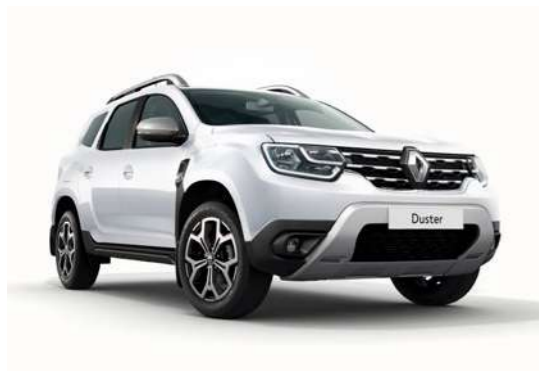
Белый BLANC GLACIER