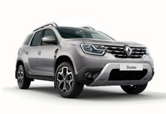
Серебристый металлик GRIS PLATINE