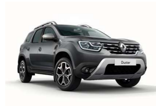
Серый металлик DARK GREY