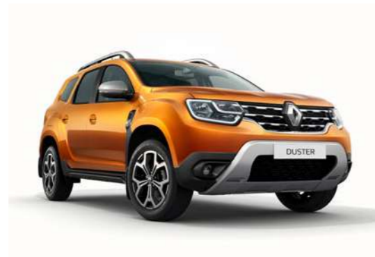
Оранжевый металлик ORANGE ATACAMA