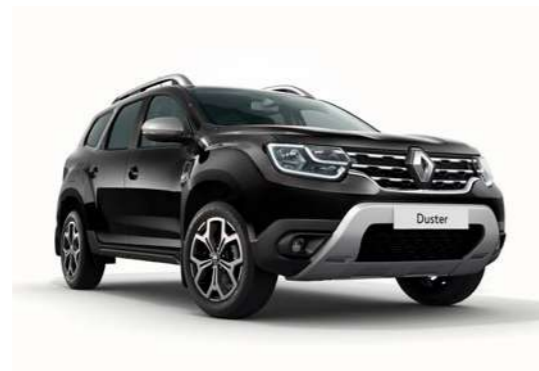
Чёрный металлик NOIR NACRE