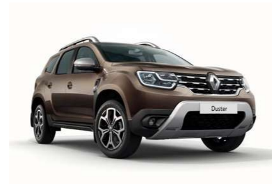
Серо-коричневый металлик TENAKURU